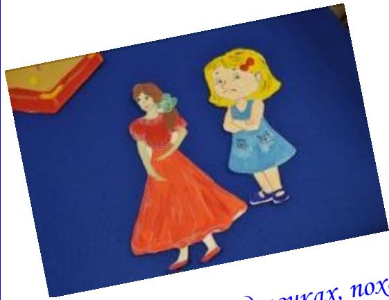
Эта сказка о двух девочках, похожих на самих авторов