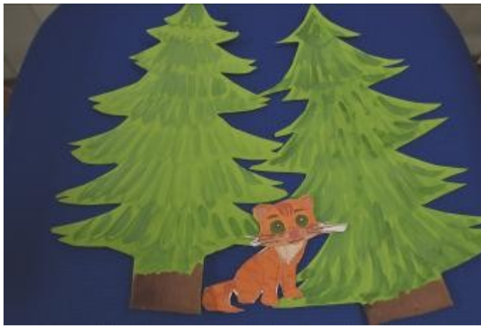
А еще о непослушном рыжем котенке, из-за которого начались приключения