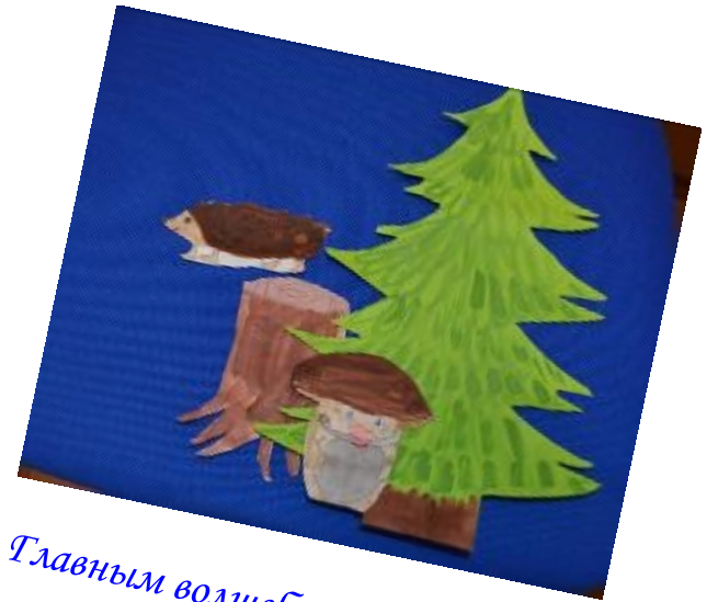
Главным волшебником в сказке является Гриб-Боровик