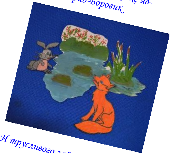
И трусливого зайчишку они спасли от хитрой лисы