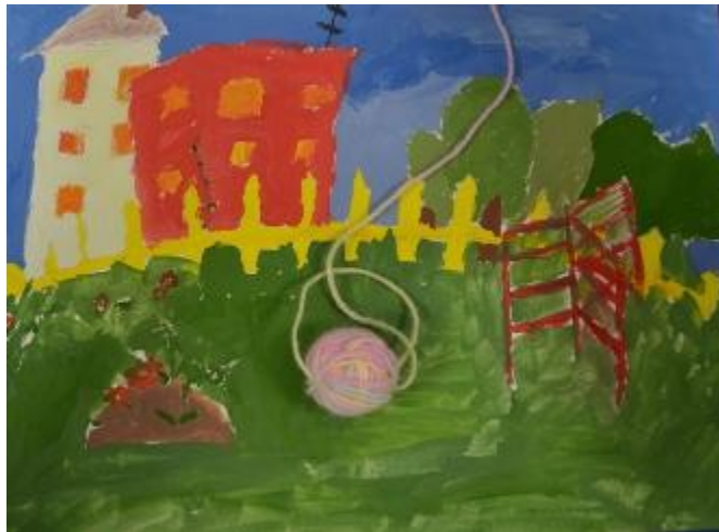
А вел их по дороге Волшебный Клубок