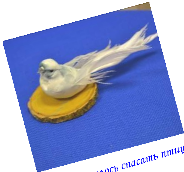
Девочкам пришлось спасать птиц и животных